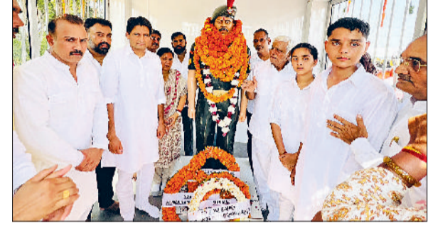
झज्जर। शहीद की प्रतिमा के अनावरण के दौरान उपस्थित सांसद दीपेंद्र हुड्डा एवं अन्य।