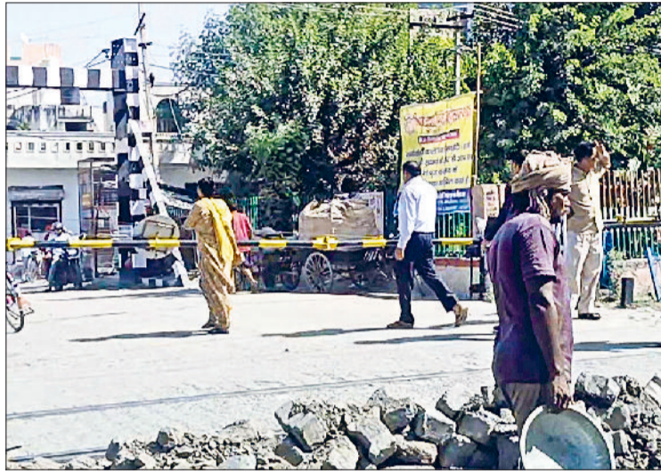
बहादुरगढ़। मरम्मत कार्य के चलते बंद की गई बराही फाटक।

मेट्रोनेस कार्य के चलते लगातार दूसरे दिन भी बराही फाटक बंद रही। वहीं परनाला फाटक भी सुबह 11 से शाम सात बजे तक बंद की गई। दो फाटक और अंडरपास बंद रहने के कारण हजारों लोगों को परेशानी झेलनी पड़ी। सुबह से रात तक लोग वैकल्पिक रास्तों से आते जाते रहे। इस कारण नाहरा-नाहरी प्लाईओवर पर भीड़भाड़ रही। दरअसल, बरसात के चलते रेलवे ट्रैक के स्पीपर्स में खामियां आ गई थीं। इस कारण रेलवे की ओर से इन दिनों ट्रैक की मरम्मत की जा रही है। शुक्रवार को बराही फाटक पर सुबह 9 से रात 12 बजे तक मरम्मत कार्य किया गया। इस कारण दिनभर फाटक बंद रही। शनिवार को भी यही सिलसिला जारी रहा और सुबह 9 बजे बराही फाटक बंद कर दी गई। रात करीब 12 बजे तक फाटक बंद रही।