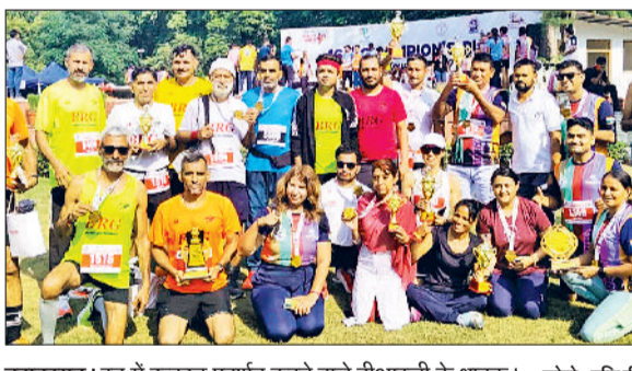
बहादुरगढ़। रन में उत्कृष्ट प्रदर्शन करने वाले बीआरजी के धावक।