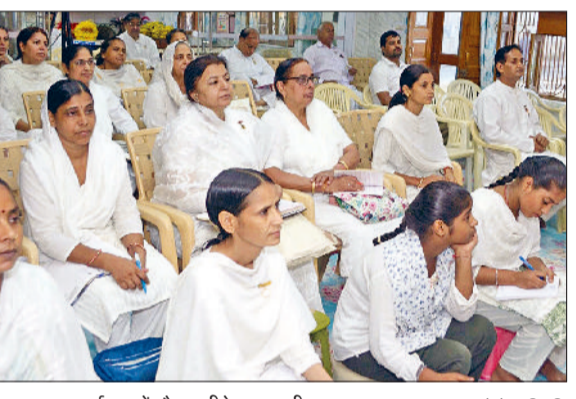
बहादुरगढ़। कार्यक्रम में मौजूद बीके अनुयायी। फोटो: हरिभूमि