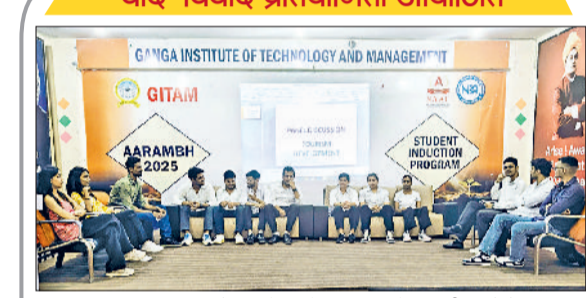
झज्जर। वाद-विवाद प्रतियोगिता में अपने विचार रखते विद्यार्थी।