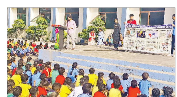
झज्जर। विद्यार्थियों को रेबीज के बचाव संबंधी जानकारी देते विषय विशेषज्ञ।