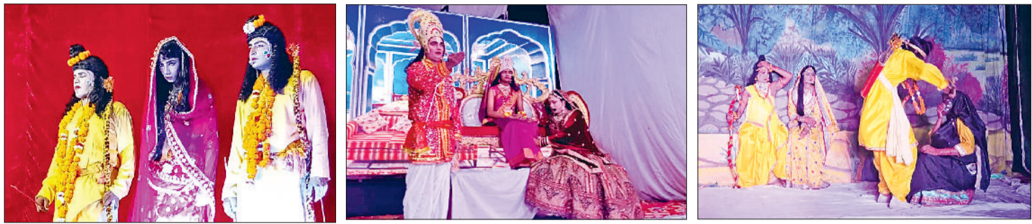
झज्जर। चौदह वर्षों के लिए वन को जाते हुए श्रीराम, सीया एवं लक्ष्मण,रानी कौशल्या के समक्ष वन जाने की आज्ञा लेते हुए श्रीरामचंद्र एवं सीता, राक्षसी शूर्पणखा की नाक काटते हुए लक्ष्मण।