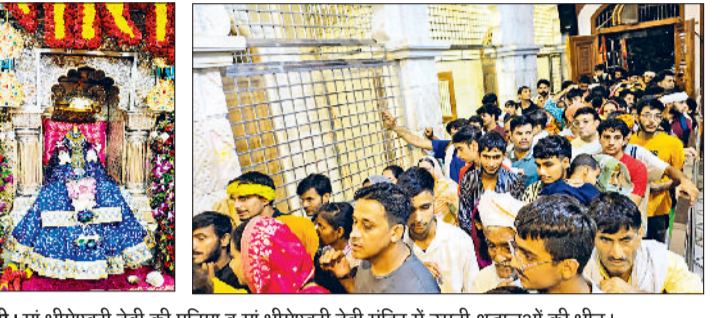
बेरी। मां भीमेश्वरी देवी की प्रतिमा व मां भीमेश्वरी देवी मंदिर में उमड़ी श्रद्धालुओं की भीड़।

बाजारों में व्रत एवं उससे जुड़ी वस्तुओं की जमकर खरीदारी हो रही है। किरायापों की दुकानों पर विशेष रूप से व्यापारियों की ओर से नवरात्र पर्व से जुड़े सामान को लेकर साज सज्जा की गई है।