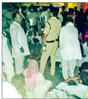
हरिभूमि न्यूज ►► झंझर

बेरी कलानौर मार्ग बाधित होने से वाहन चालक परेशान ■ तारकोल फैक्ट्री में धमाके में पांच घायल हुए थे