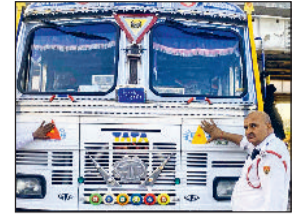
बहादुरगढ़। ट्रक पर रिफ्लेक्टर टेप लगाती पुलिस।