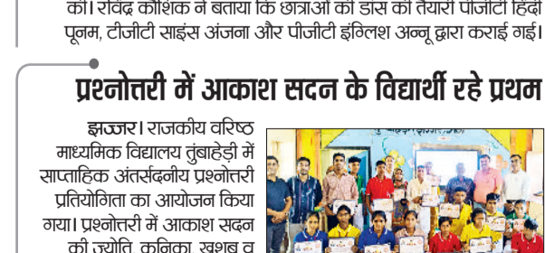
झज्जर। शिक्षकों के साथ उपस्थित गुपु डांस की विजेता छात्राएं।